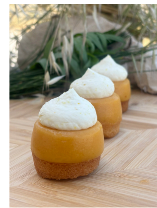
Sablé breton, crème d'abricot