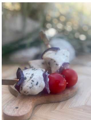
Brochette de poulet à la provençale