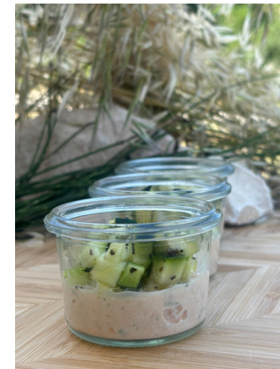
Rillettes de truite d'Ardèche