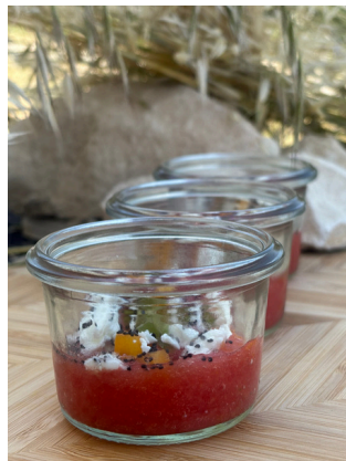
Crème fine de poivron rouge