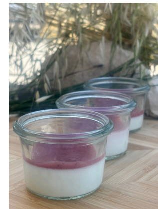
Panna cotta, coulis