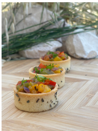
Piperade de légumes, sablé aux herbes