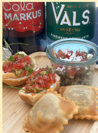
Planche charcuteries / fromages 15 x pains bagnat, tapenade verte et mozzarella di bufala 15 x tourtons courgette parmesan 15 x verrines lentilles à la grecque - 1 x nectar d'abricot local 100cl 1 x cola "Markus" 75cl 1 x Vals 75cl

Pour 12 à 15 personnes Vaisselle réutilisable incluse