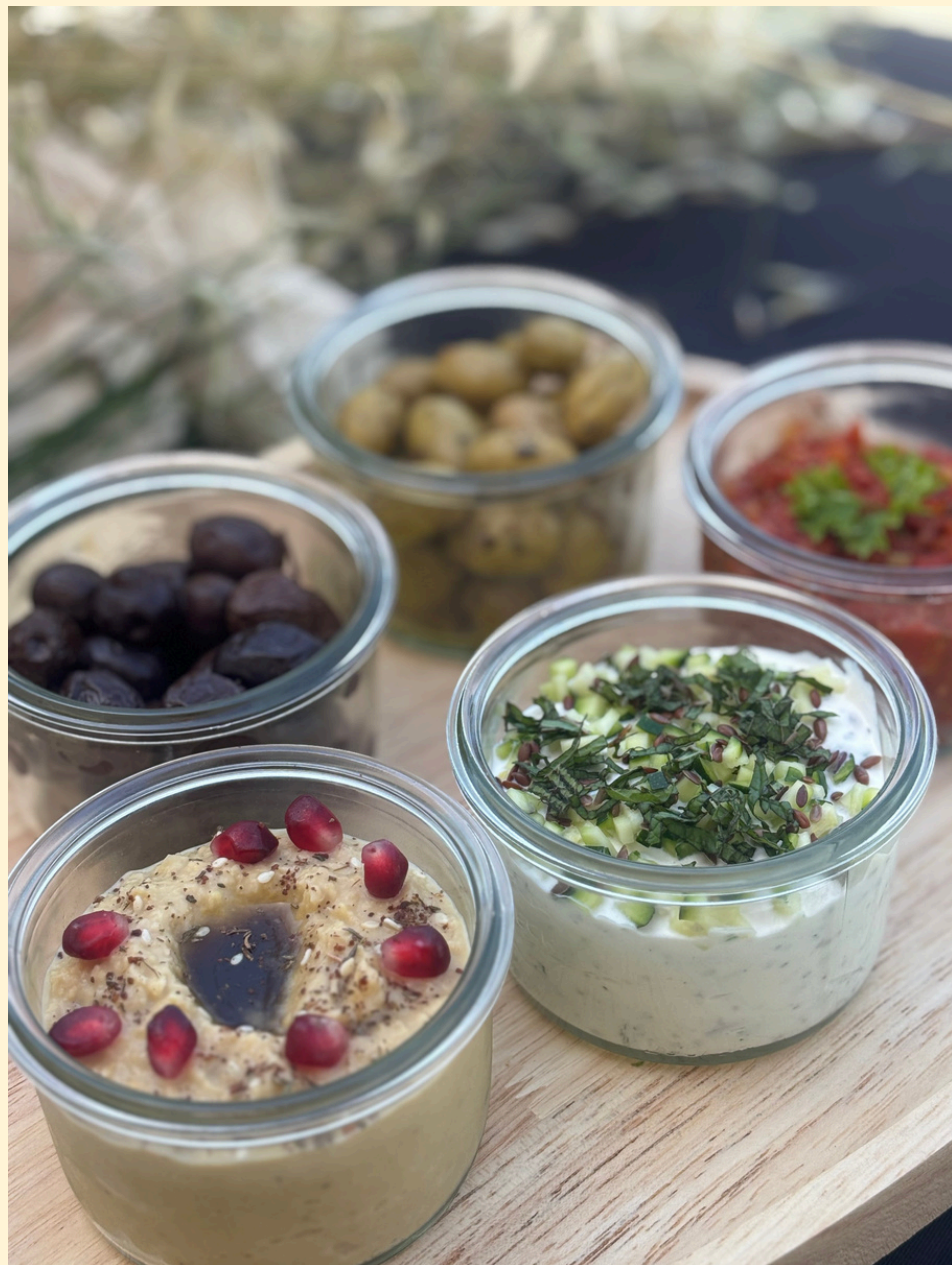
PLANCHE DE CHARCUTERIES