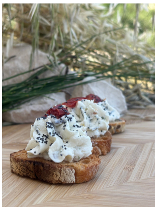
Toast fromage frais, tomate confite