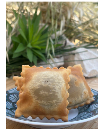
Tourtons tapenade et courgettes parmesan