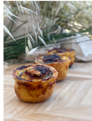
Quiche courgette et chèvre