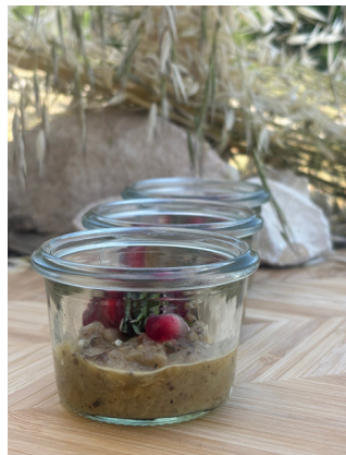
Caviar d'aubergine, grenade