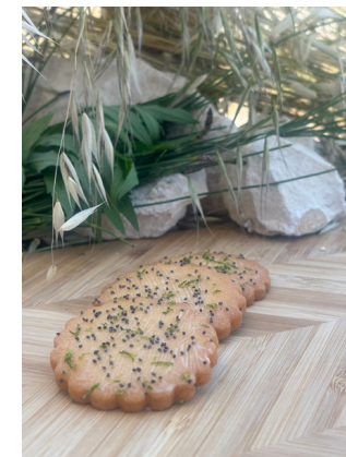
Biscuit citron pavot