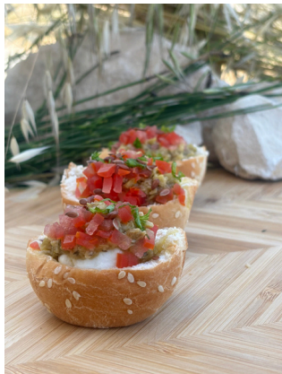
Pain bagnat, tapenade verte et mozzarella